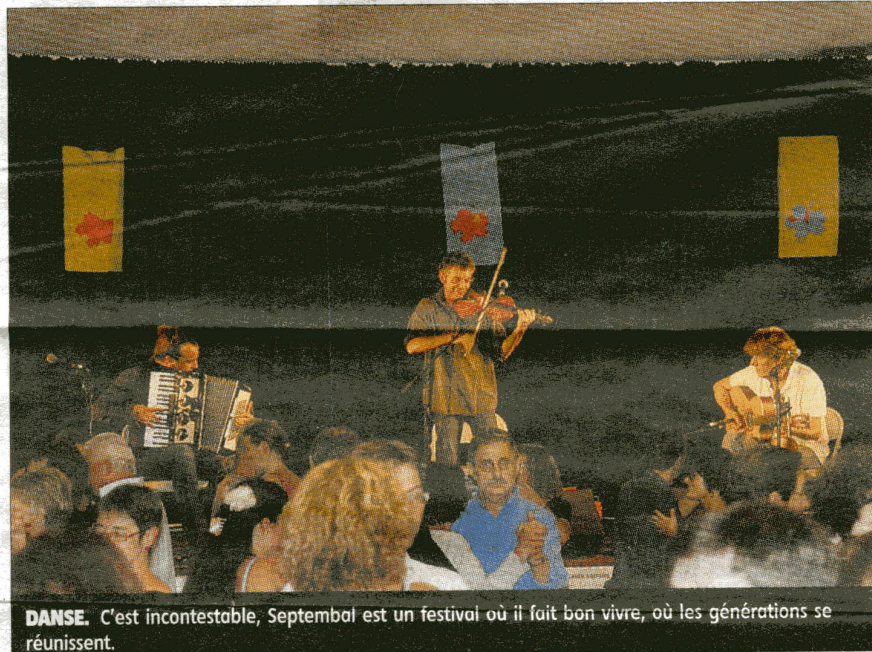
DANSE. C'est incontestable, Septembal est un festival où il fait bon vivre, où les générations se réunissent.

Bien sûr, toute l'équipe de l'AMTCN cherche avant tout à proposer un moment festif mais quand en plus il se teinte d'une