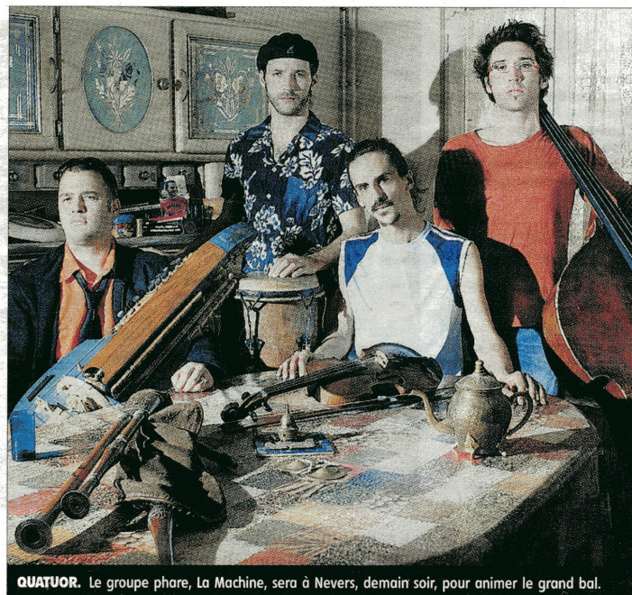
QUATUOR. Le groupe phare, La Machine, sera à Nevers, demain soir, pour animer le grand bal.

Au programme, beaucoup de danse, polka, mazurka, scottish, valse, ronde, bourrée, et de musique. « 80 % du réper-