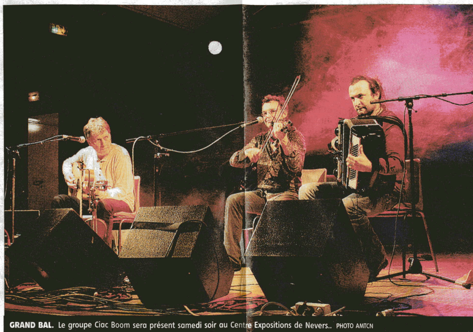
GRAND BAL. Le groupe Ciac Boom sera présent samedi soir au Centre Expositions de Nevers..

déambulation avec un final place de la Résistance. Tous les musiciens pourront nous rejoindre pour un bœuf géant ». Des morceaux choisis que les participants devront apprendre avant (MP3 ou partition fournies).